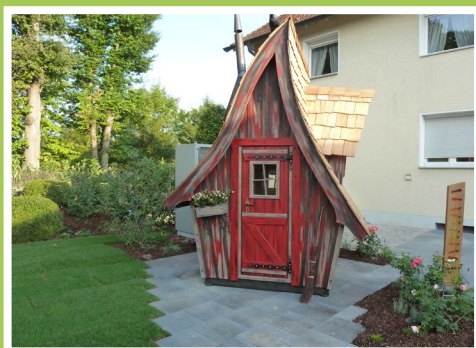
Unser Hexenhäuschen im Garten