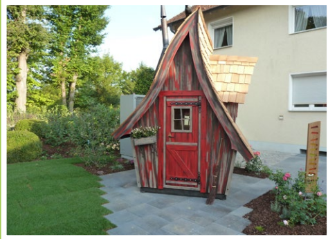
Unser Hexenhäuschen im Garten